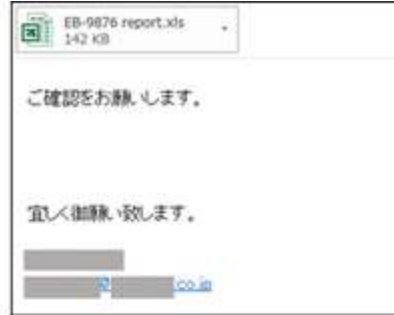
Excel文書ファイルが添付された攻撃メール