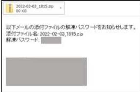
本文が日本語で書かれ、パスワード付きZIPファイルが添付された攻撃メール

塗り潰した箇所には実際の兄弟姉妹方のお名前やメールアドレス、電話番号が表示されます。